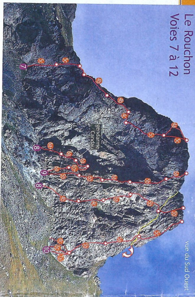
vue du Sud Ouest

ACCÈS GÉNÉRAL. Comme pour le secteur E14, depuis P27 suivre le sentier (GR58 o ) du col de Chamoussière ; le quitter rapidement main gauche pour remonter entre les torrents de Cornivier et des Ciblères ; tirer plein Nord à vue de la face Sud ; 1 h à 1 h 30 suivant les voies.