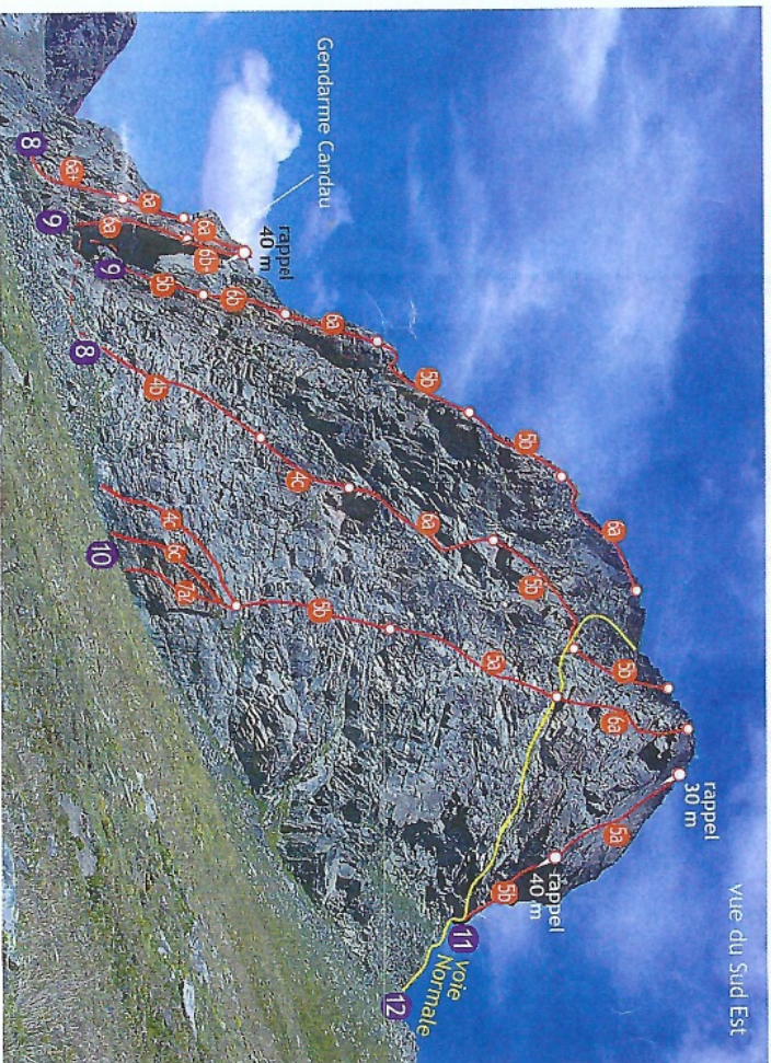
vue du Sud Est

Ouvreurs : François Rolland et Co. Été 1998. Difficulté : 6b max, 6a obl. Horaire : 2 à 3 h. Dénivelée : 160 m. Équipement : spits.